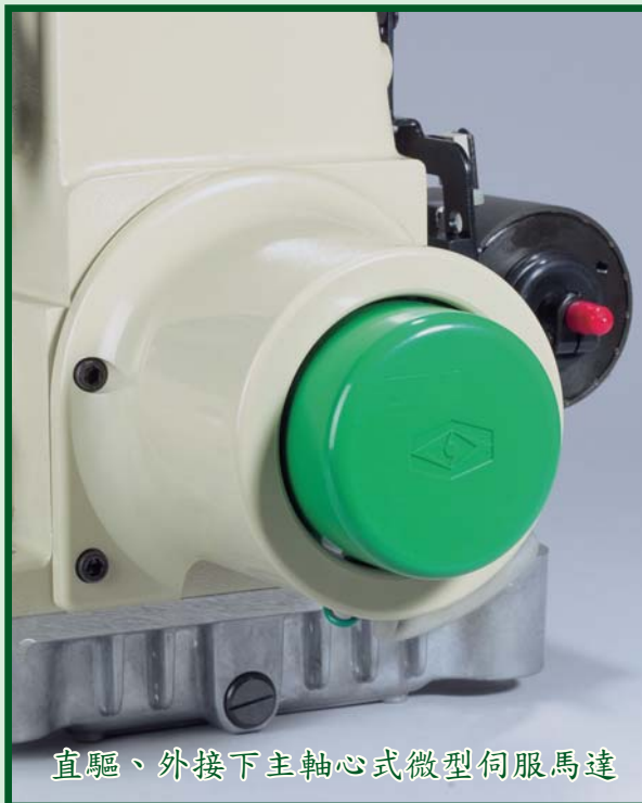
直驅、外接下主軸心式微型伺服馬達